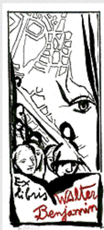
M. PURI HERRERO

Entre los 103 ex-libris hay dibujos, grabados, fotografías y diseños gráficos originales inspirados en la obra y la personalidad de Walter Benjamin. Es importante destacar el carácter simbólico de la muestra que ofrece así un homenaje al significativo filósofo judío que en 1940 se quitó la vida en la frontera franco-española de Portbou para no caer en manos de la Gestapo. En este sentido la muestra quiere recordar a quienes vieron en la frontera un paso hacia la libertad o que, como Machado o Benjamin, encontraron en ella la muerte.